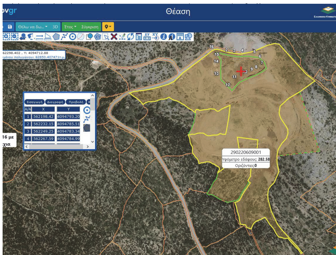
Εικ. 2.: Το γήπεδο του ΧΑΔΑ (1-16) εντός του ακινήτου με ΚΑΕΚ 290220609001 (62.850m 2 ).

Πέραν των παραπάνω και λαμβάνοντας υπόψη τα στοιχεία που προσκομίστηκαν καθώς και από τα πρακτικά των συνεδριάσεων των επιτροπών καταγραφής διαπιστώθηκαν γενικώς τα εξής: